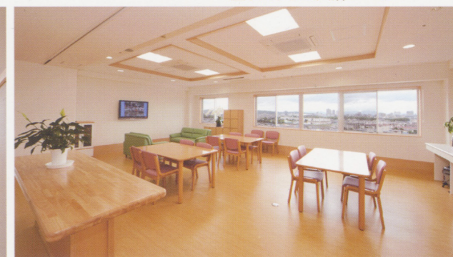
憩いと寛ぎのダイニング