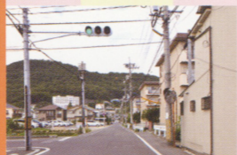
9 つしまヒルズが大きく見えます