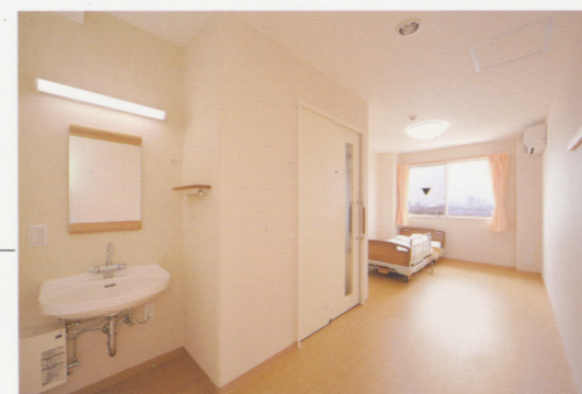
心安らぐ景色を見ながら、広々とした居室