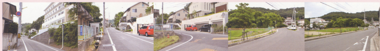
16 右手の坂を上って、到着 15 道なりに真っ直ぐ 14 最初の路地を左折 13 少し坂になっています 12 つしまヒルズを左に望みながら、直進