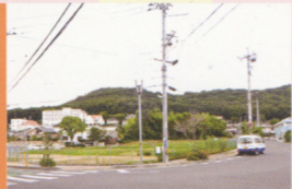
11 緑地に添って左折