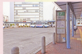
2 岡電バス7番のりば「妙善寺行」