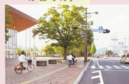
3 いずみ町運動公園