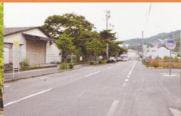
5 妙善寺バス停(終点)を降りて、直進