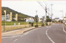
10 つきあたりを右折