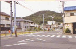
7 左山手につしまヒルズが見えます