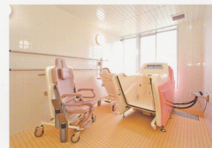
座ったままの入浴サービス

ももたろうアシストホーム つしまヒルズ Tsushima Hills Momotaro Assisted Home